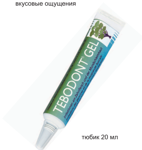
тубик 20 мл