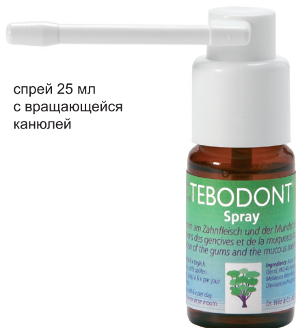
спрей 25 мл с вращающейся канюлей